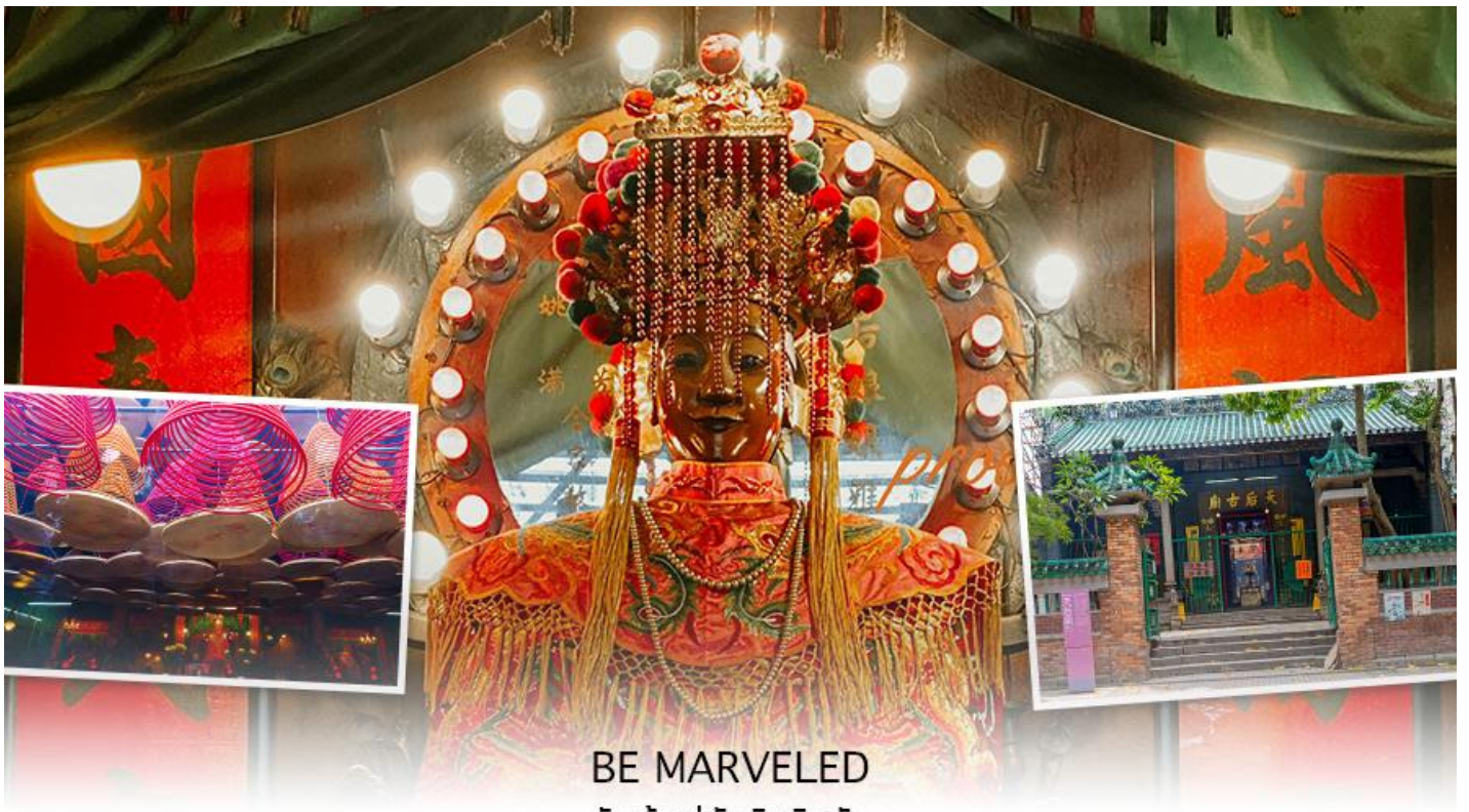
BE MARVELED วัดเจ้าแม่ทับทิมกินหัว

หลังจากนั้นนำทุกท่านเดินทางไปยัง Citygate Outlets เป็นแหล่งรวมร้านค้าตรงจากผู้ผลิตที่ใหญ่ที่สุดในฮ่องกง โดยรวบรวมกว่า 150 แแบรนด์ระดับโลกไว้ในที่เดียว โดยแจกส่วนลดสูงสุด 90% ตลอดทั้งปี แวะช้อปปิ้งแฟชั่นและเครื่องประดับ สินค้าเพื่อสุขภาพและความงาม สินค้าอิเล็กทรอนิกส์ จิวเวลรีและนาฬิกา เสื้อผ้าเด็ก กีฬาและกิจกรรมกลางแจ้ง ฯลฯ