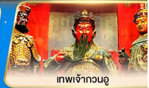
เทพเจ้ากวนอู