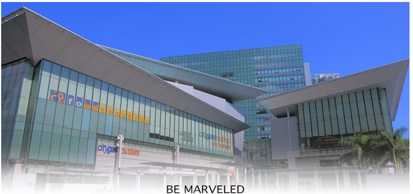
BE MARVELED CITYGATE OUTLETS

หลังจากนั้นนำทุกท่านเดินทางไปยัง Citygate Outlets เป็นแหล่งรวมร้านค้าตรงจากผู้ผลิตที่ใหญ่ที่สุดในฮ่องกง โดยรวบรวมกว่า 150 แแบรนด์ระดับโลกไว้ในที่เดียว โดยแจกส่วนลดสูงสุด 90% ตลอดทั้งปี แวะช้อปปิ้งแฟชั่นและเครื่องประดับ สินค้าเพื่อสุขภาพและความงาม สินค้าอิเล็กทรอนิกส์ จิวเวลรีและนาฬิกา เสื้อผ้าเด็ก กีฬาและกิจกรรมกลางแจ้ง ฯลฯ