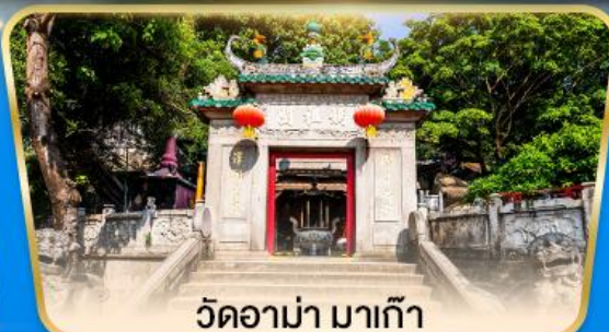
วัดอามา มาเก๊า