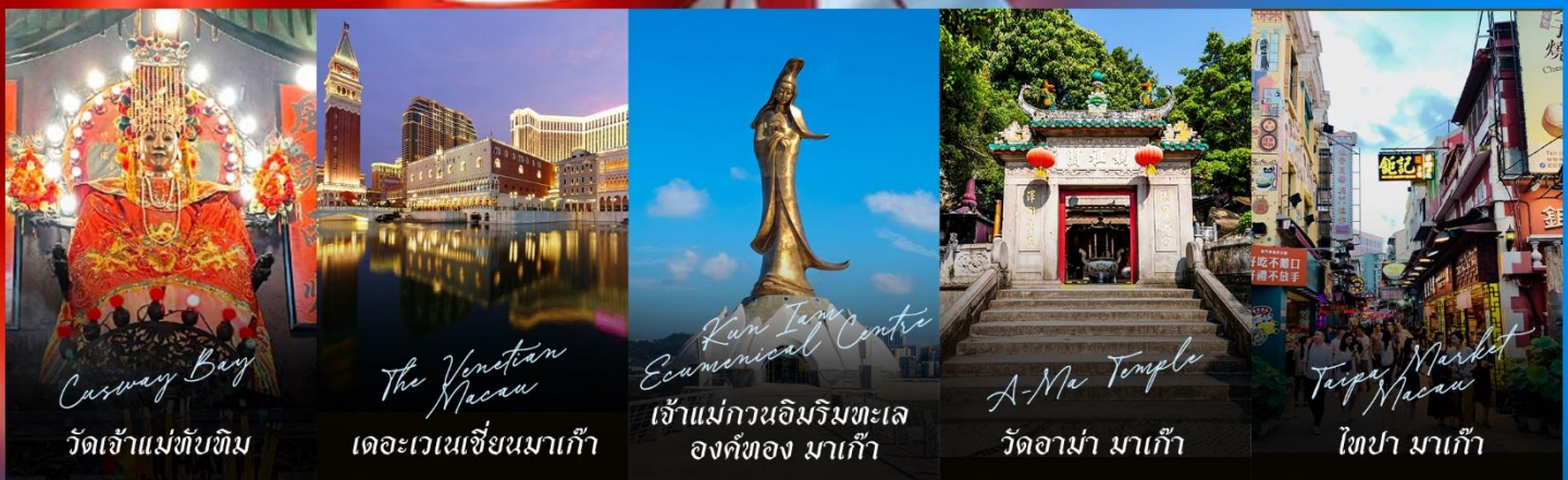
Casway Bay วัดเจ้าแม่ทับทิม

รายการทัวร์ข้างต้นอาจมีการปรับเปลี่ยนเพื่อความเหมาะสม