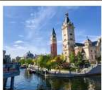
เมืองเวนิสแห่งต้าเหลียน