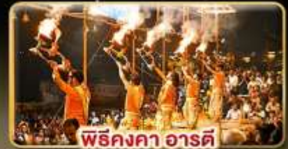
พิธีคงคา อาร์ต