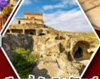
เมืองถ้ำอพลิสตซิคเคห์