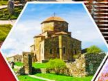
วิหารจอร์เจีย