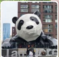
แพนด้าปิ่นตัก IFS