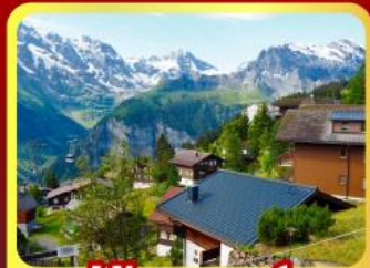
หมู่บ้านเมอร์สเน